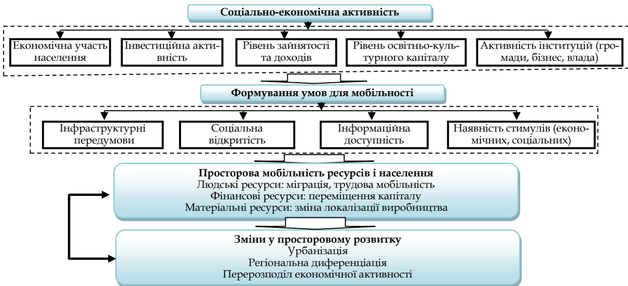
Рис. 1. Соціально-економічна активність як фактор просторової мобільності ресурсів і населення.

Таким чином, соціально-економічна активність і мобільність перебувають у взаємозв'язку: активність стимулює мобільність, а остання своєю чергою відкриває нові можливості для соціально-економічного розвитку.