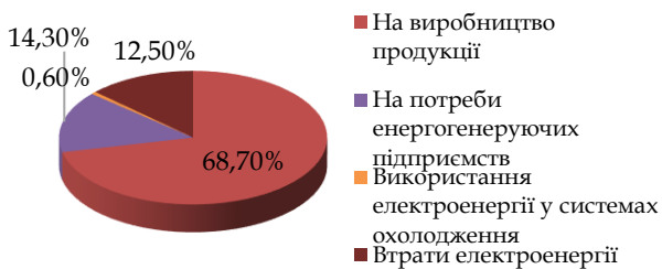
Рис. 3. Структура використання електроенергії в Україні, 2020 р., %

*Побудовано та систематизовано автором на основі джерел: [1; 11]