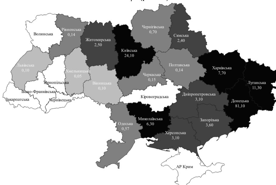
Рис. 3. Кількість пошкоджених об'єктів житлового фонду за регіонами України, тис. од. [6]

Міста Маріуполь, Харків, Чернігів, Северодонецьк і Лисичанськ зазнали найбільших пошкоджень житлового фонду. У Северодонецьку, наприклад, пошкоджено майже 90% всього житлового фонду, а кількість пошкоджених житлових будівель, включаючи багатопверхові будинки та приватні будинки, продовжує зростати через продовження активних бойових дій на територіях Харківської, Луганської, Донецької, Запорізької, Херсонської та Миколаївської областей, а також тимчасово окупованих частин території України (рис. 3).