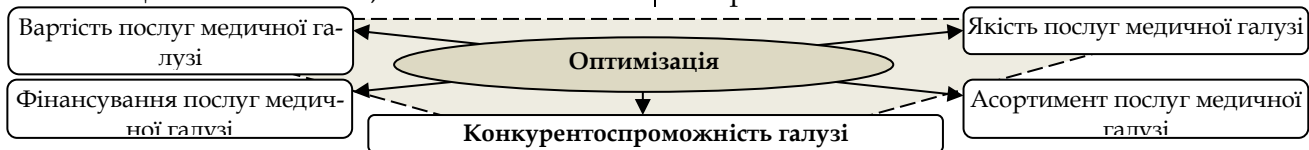
Рис. 2. Параметри конкурентоспроможності галузі та її складові

розрахунок її реальних потреб у фінансових та інших матеріальних ресурсах; обґрунтоване визначення очікуваних доходів та видатків; створення дієвого механізму ефективного та гармонійного функціонування, як кожного окремого елементу системи, так і всієї системи загалом, щодо надання якісних медичних послуг та задоволення суспільних потреб.