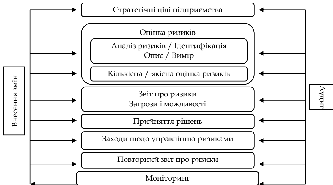
Рис. 3. Схема процесу ризик-менеджменту в контексті формування організаційно-економічного механізму економічної безпеки та фінансового захисту бізнесу

підприємства оперативні рішення щодо управління ризиками як зовнішнього, так і внутрішнього середовища (рис. 3).