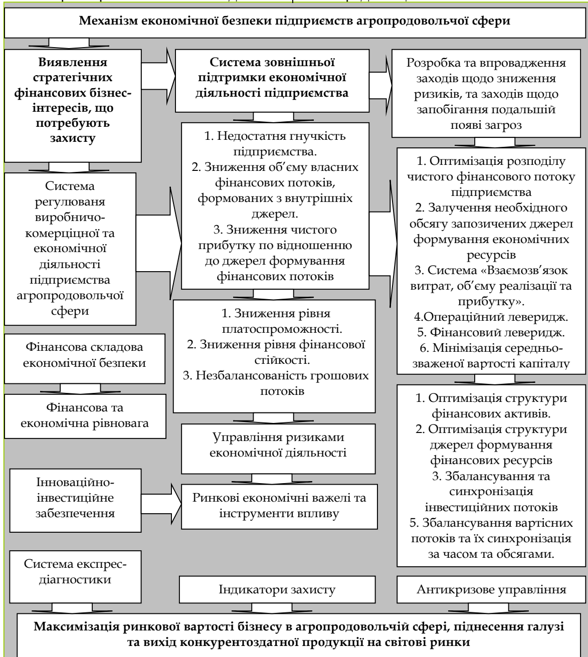
Рис. 2. Формування дворівневого механізму фінансово-економічної безпеки підприємств агропродовольчої сфери

бізнесу та його вимоги у перспективному та стабільному розвитку в динамічному ринковому середовищі.