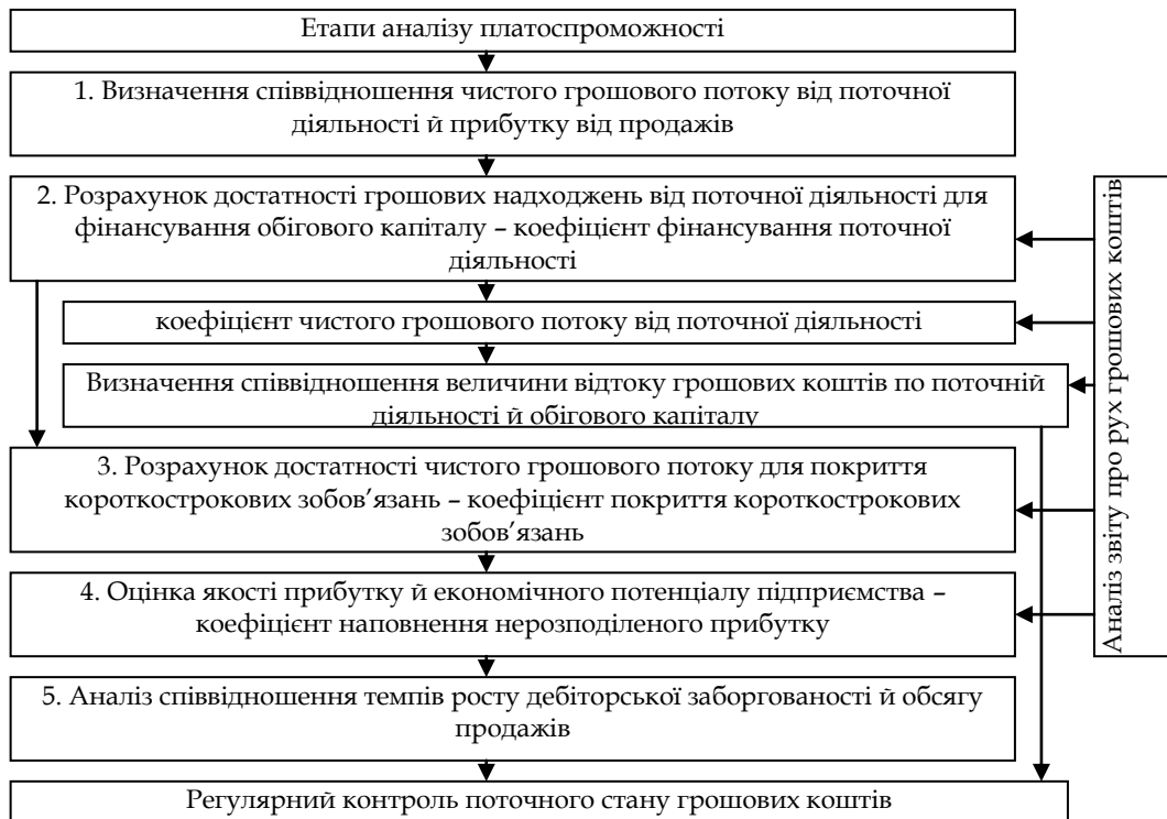
Рис. 2. Алгоритм аналізу платоспроможності для харчових підприємств

Необхідна нова система показників фінансової стабільності у взаємозв'язку з рентабельністю власного капіталу й кредитуванням харчових товаровиробників, яка дозволить оцінити можливість розширення діяльності за допомогою залучення позикових коштів.